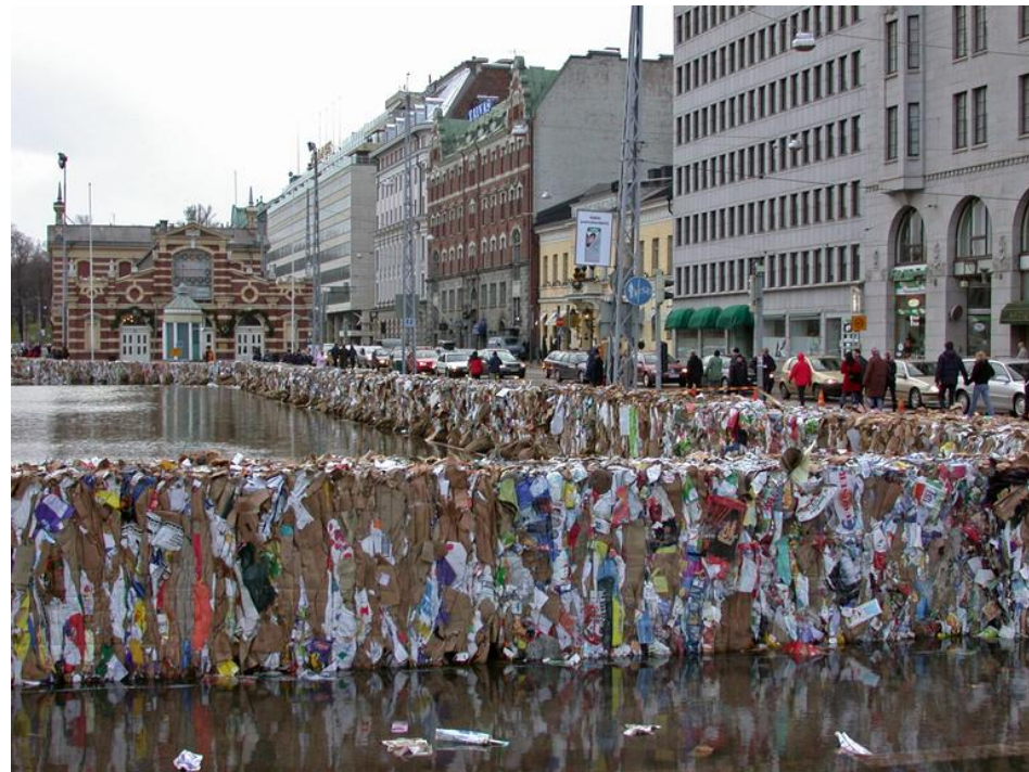
Meri tulvii Kauppatorille (9.1.2005)