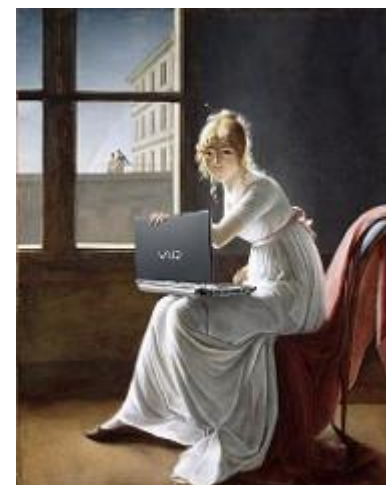
Mike Licht, Young Woman Blogging, after Marie-Denise Villers, CC BY 2.0, lähde Flickr