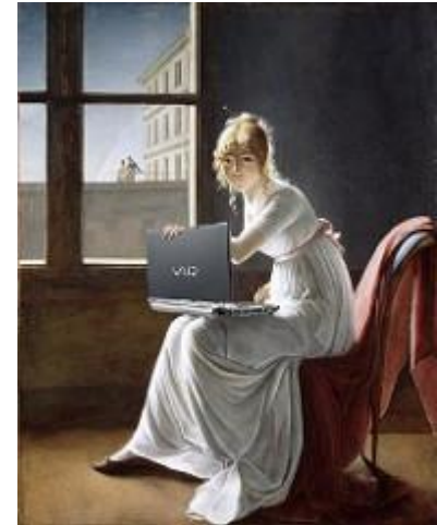
Mike Licht, Young Woman Blogging, after Marie-Denise Villers, CC BY 2.0, lähde Flickr