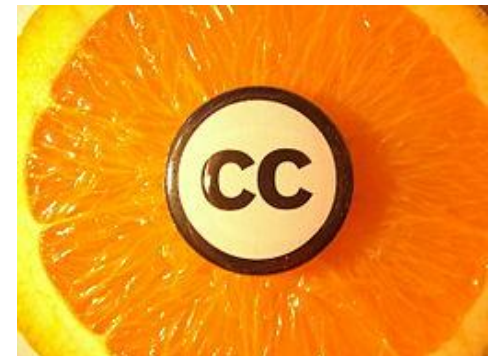
Yamashita Yohei, CC on Orange, CC BY 2.0, lähde Wikimedia Commons