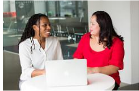
Janique-ka John, burtonsusan1, colibricansada ja John Smith: Women in Tech. Lähde: Flickr, lisenssi CC BY.