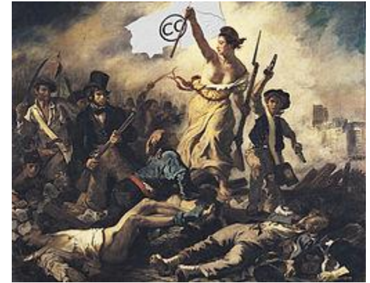
Ju gatsu mikka: CC guidant les contributeurs, Eugène Delacroix derivative work, CC BY-SA 3.0, lähde Wikimedia Commons