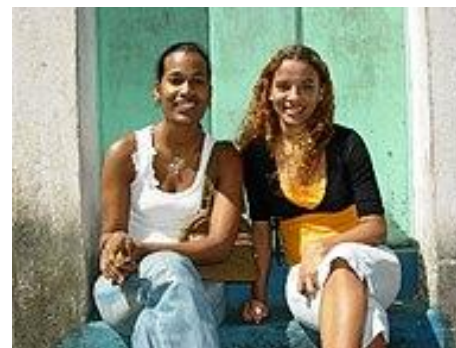
By Adam Jones Adam63 - Own work, CC BY-SA 3.0, Lähde: Wikimedia Commons.